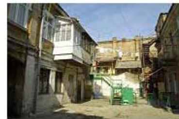
Дворик Утесова почти не изменился